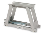
EcoLeg mit Schnellverschluss